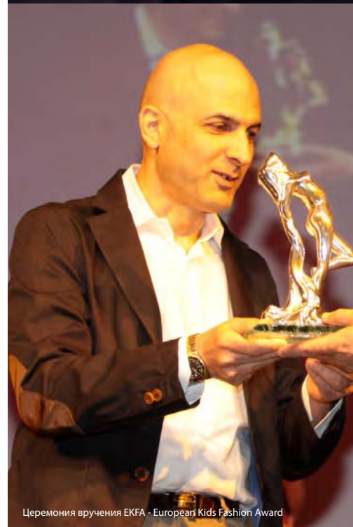
Церемония вручения EKFA - European Kids Fashion Award