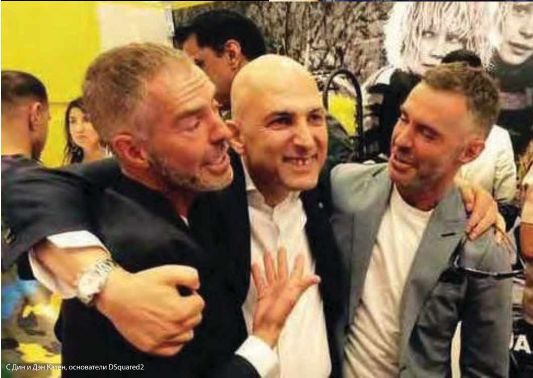
С Дин и Дэн Катен, основатели DSquared2