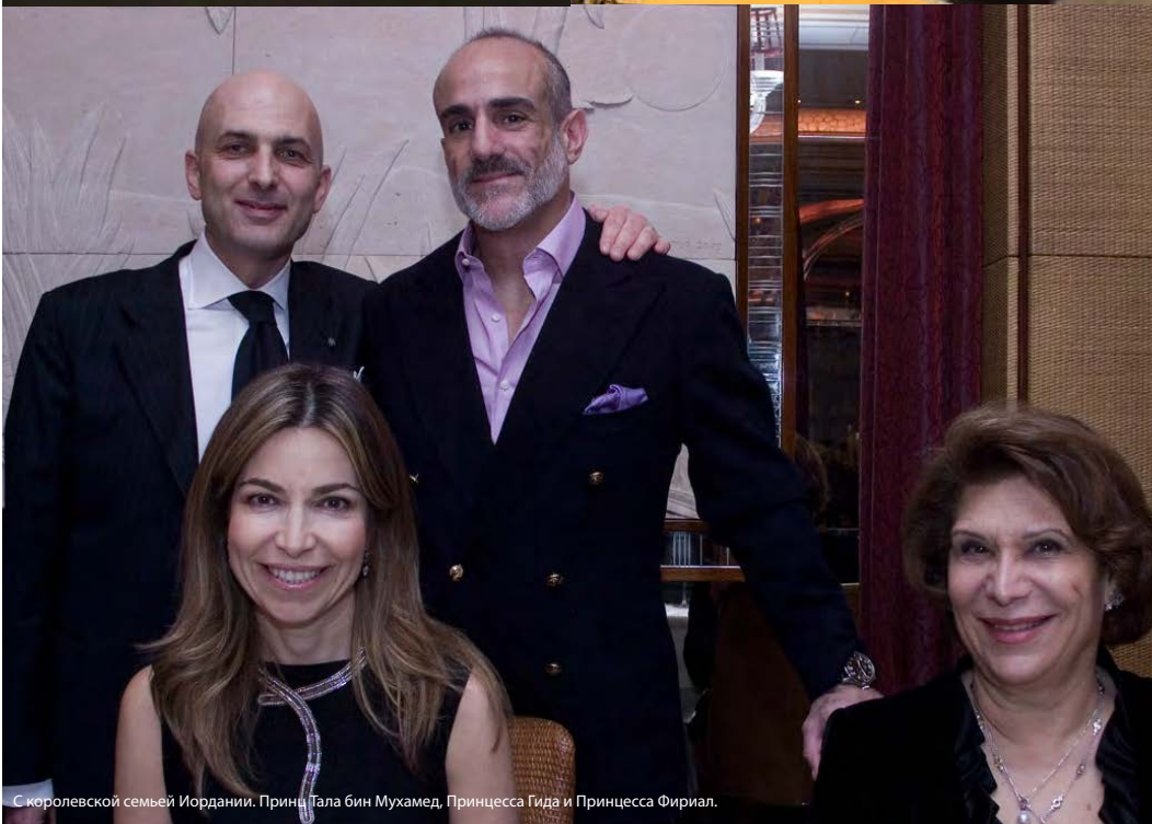
С королевской семьей Иордании. Принц Тала бин Мухамед, Принцесса Гида и Принцесса Фириал.