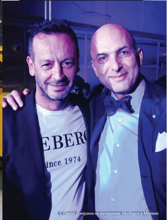
С Паоло Джерани на вечеринке Айсберга в Милане