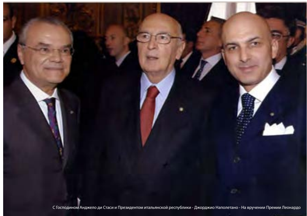
С Господином Анджело ди Стаси и Президентом итальянской республики - Джорджо Наполетано - На вручении Премии Леонардо