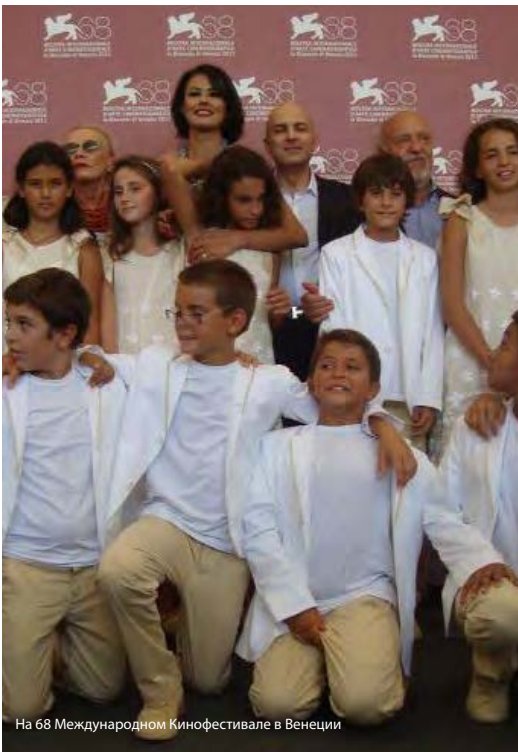
На 68 Международном Кинофестивале в Венеции