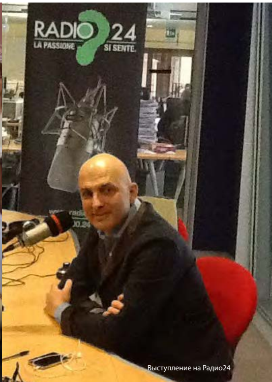
Выступление на Радио24