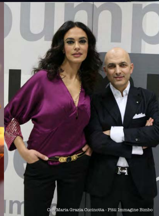
Con Maria Grazia Cucinotta - Pitti Immagine Bimbo