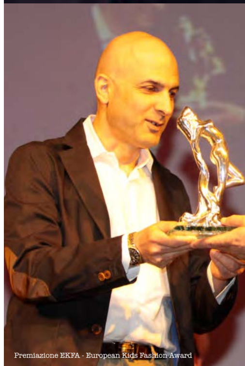
Premiazione EKFA - European Kids Fashion Award