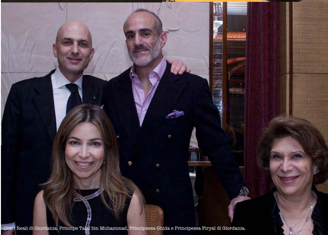
Con i Reali di Giordania, Principe Talal bin Muhammad, Principessa Ghida e Principessa Firyal di Giordania.