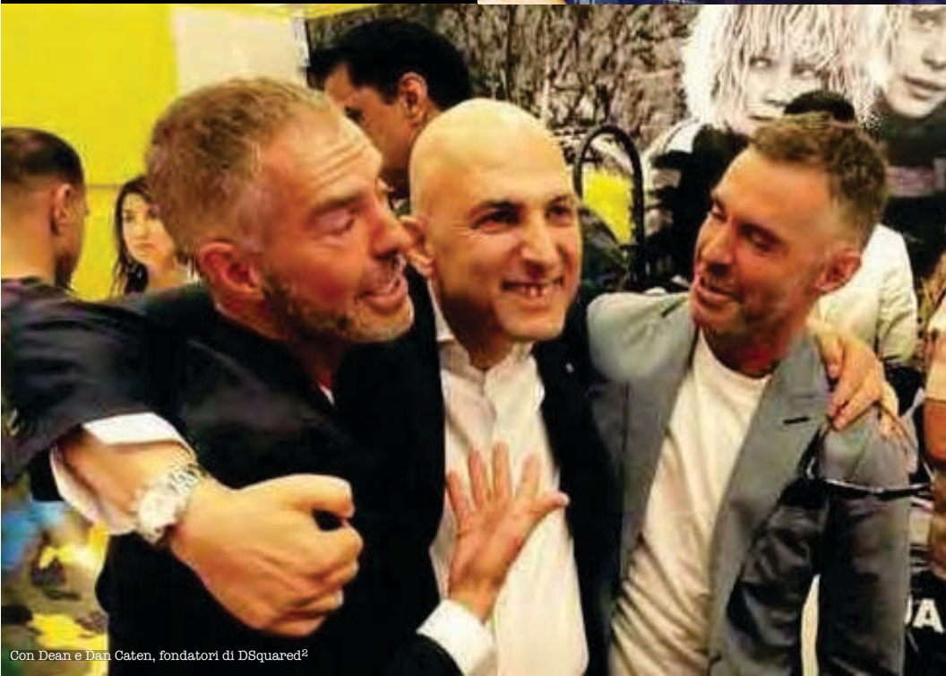
Con Dean e Dan Caten, fondatori di DSquared2